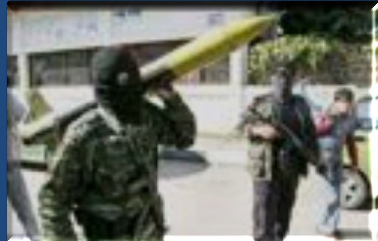
טרוריסטים או צבא שחרור? (צולם בעזה)