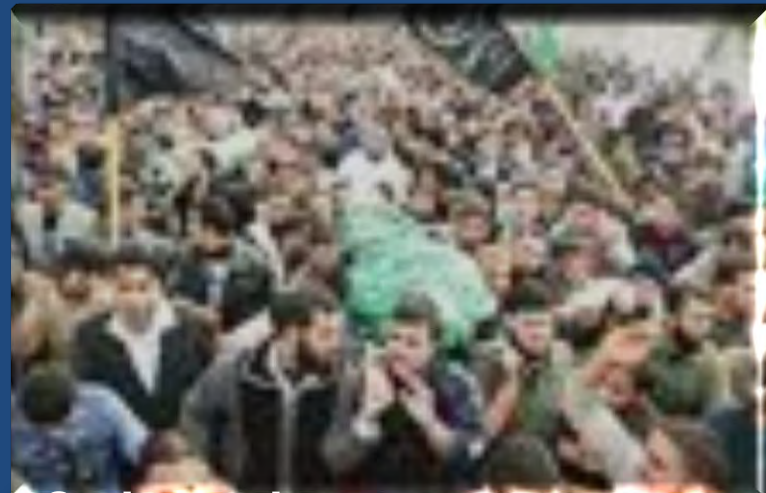
המון מוסט או אלפי אבלים? (צולם בעזה)